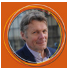
Yves RAIBAUD, géographe spécialiste de la géographie du genre.